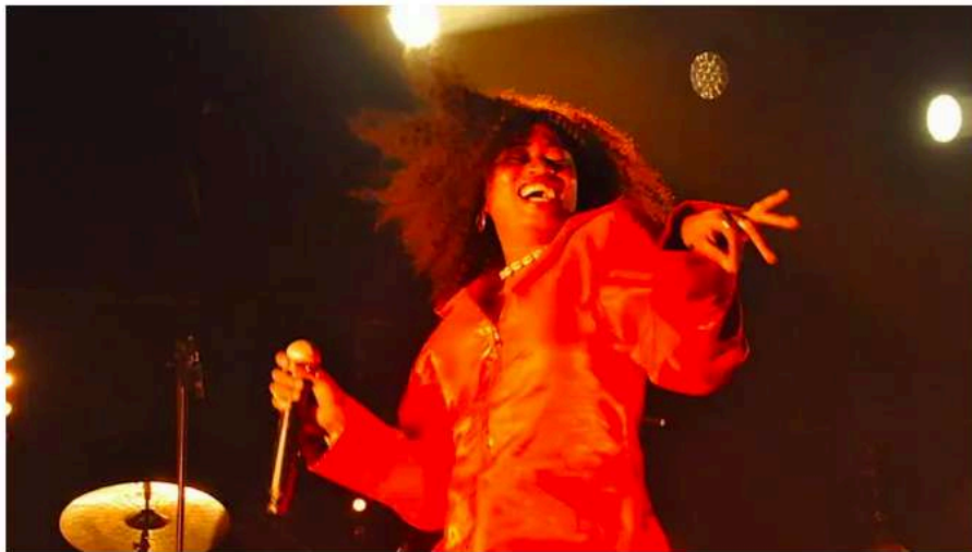
Queen Rima, 8 mars 2026

Publié le : 09/03/2026 - 11:13 Modifié le : 09/03/2026 - 11:17 6 min