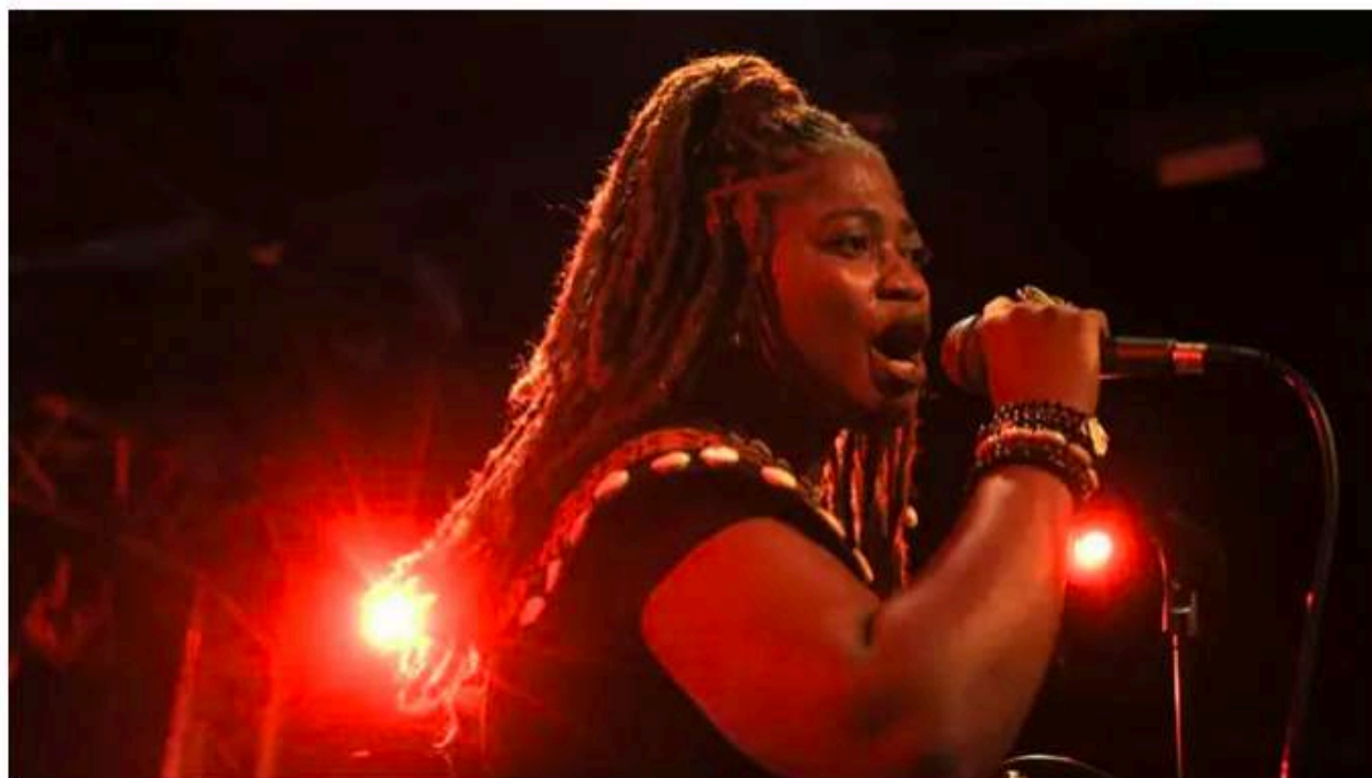
Queen Rima sur scène le 28 juin 2025 à Miramas.

« Conakry à Paris », c'est le titre du festival Africapitales qui se tient à Paris jusqu'au 15 mars. Avec des expositions, des conférences et une série de concerts. Et notre Grande Invitée Afrique ce samedi sera justement sur scène ce soir (7 mars à FGO-Barbara) ! Militante, puissante, touchante. La chanteuse guinéenne Queen Rima, lauréate du Prix Découvertes RFI 2025, répond aux questions de Guillaume Thibault.