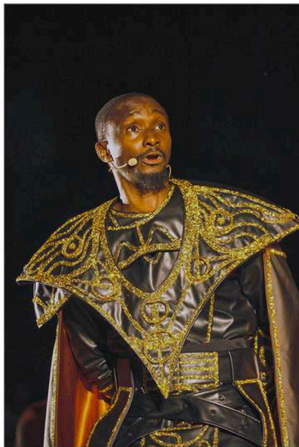
Petit Tonton